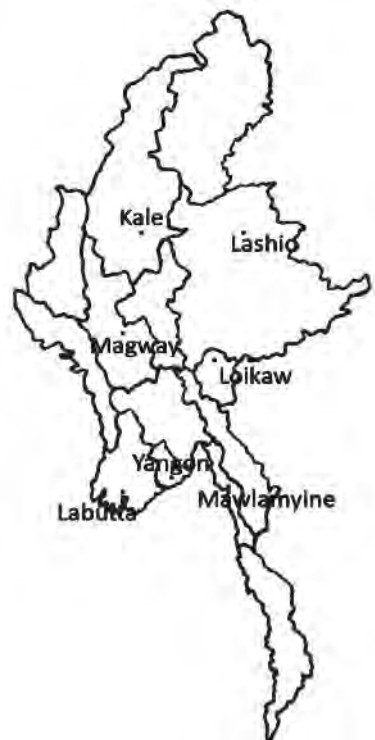
ပုံ ၁ - လေ့လာဆန်းစစ်မှု ပြုလုပ်ခဲ့သော နေရာများပြမြေပုံ