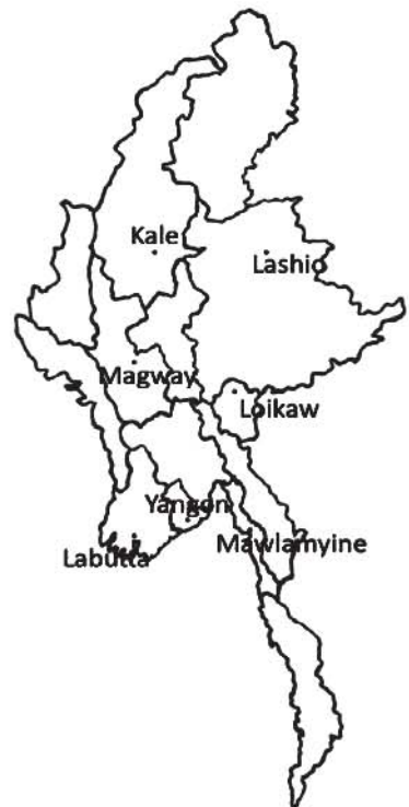
ပုံ ၁ - လေ့လာဆန်းစစ်မှု ပြုလုပ်ခဲ့သော နေရာများပြမြေပုံ